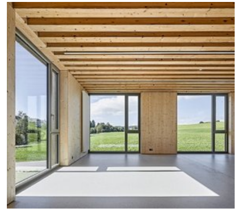
Chacune des sept classes (ci-dessus) que compte la nouvelle école de Vaulruz (FR) profite de trois orientations différentes. Le bois utilisé provient de la forêt communale.